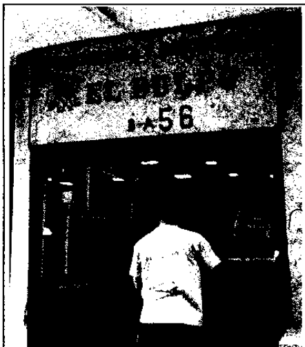
FOTOGRAFÍA 1: AVISO COMERCIAL