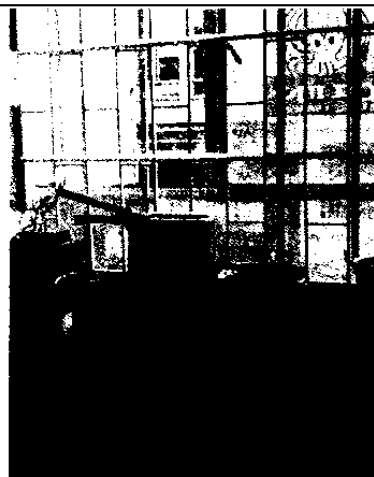
FOTOGRAFÍA 2: ESTUFA CERCA DE LA VENTANA SIN SISTEMA DE EXTRACCIÓN