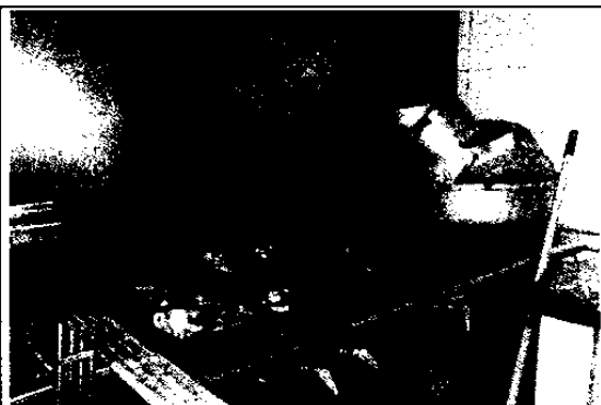
FOTOGRAFÍA 3: ESTUFA DE 3 PUESTOS